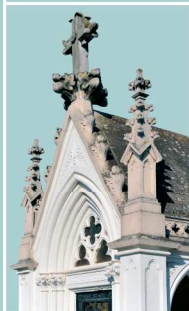
BASSE-HAM Chapelle néo-gothique