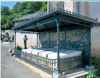
THIONVILLE CIMETIÈRE DE VOLKRANGE Tombeau Art Nouveau de la famille Bompard-Marchal