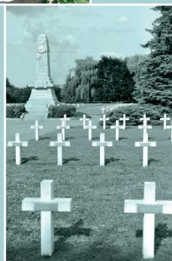
THIONVILLE CIMETIÈRE SAINT-FRANÇOIS Cimetière militaire