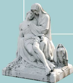
THIONVILLE CIMETIÈRE SAINT-FRANÇOIS Groupe sculpté de la Vierge de Pitié en marbre

À partir des années 1980, avec l'essor de la pratique de l'incinération, des jardins du souvenir et des colombariums sont construits pour répondre aux nouveaux rites funéraires.